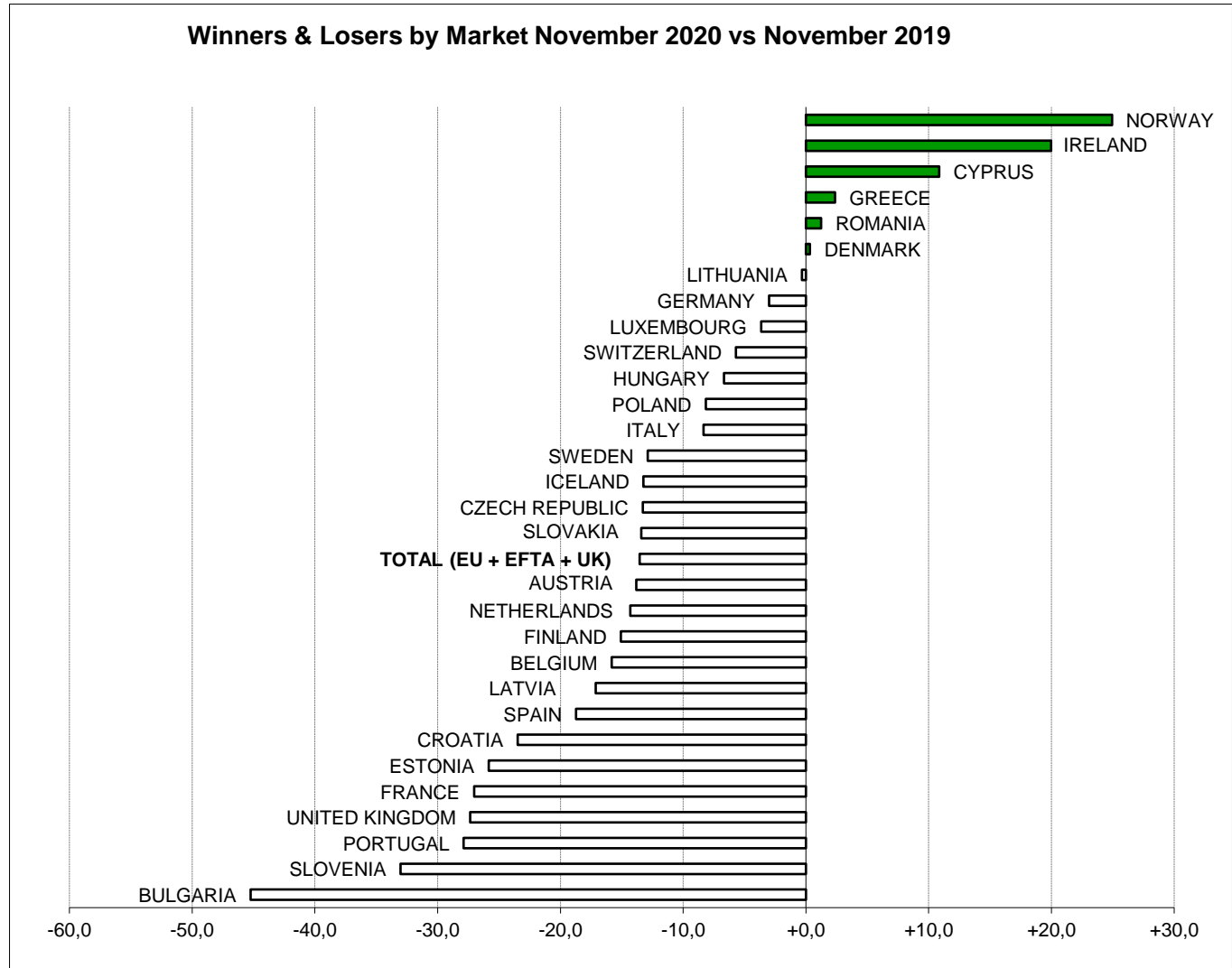
Winners & Losers by Market November 2020 vs November 2019

(*) data for Malta currently not available.