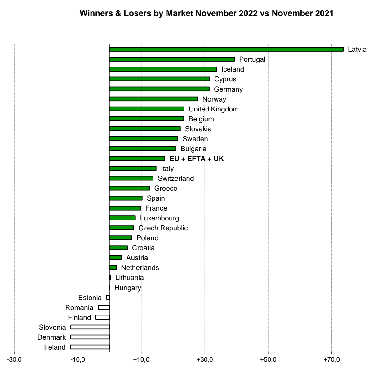
Winners & Losers by Market November 2022 vs November 2021