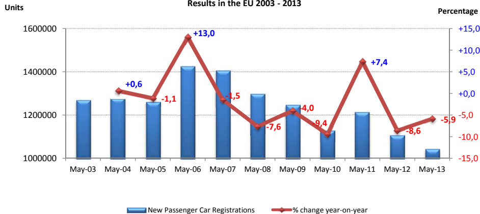
New Passenger Car Registrations in May Results in the EU 2003 - 2013

Next press release: Tuesday, July 16, 2013